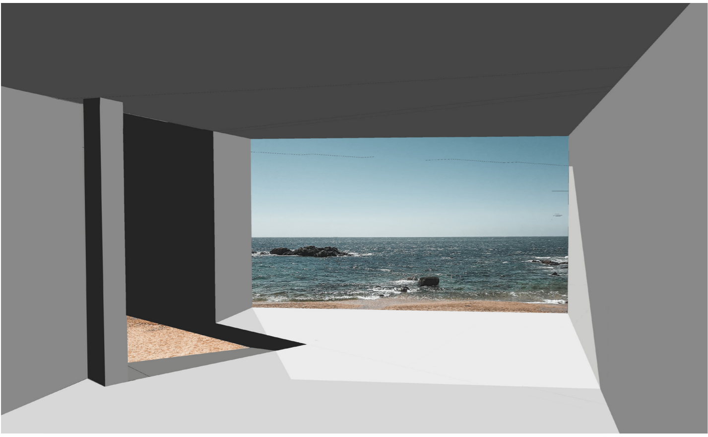
painting of the sea